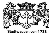
Stadtwappen von 1738

Nähere Informationen dazu erhalten Sie in unserem nächsten Mitgliederbrief.