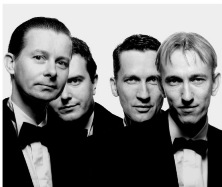
Echoes of Swing

Mit den „Echoes of Swing“ ist es gelungen eine international bekannte und geschätzte Jazz-Formation nach Dülmen zu holen. „Zwei Bläser, Schlagzeug, Piano und Forte, kein Bass: Diese eigenwillige, kompakte und wendige Formation erlaubt größte harmonische Flexibilität und bietet Freiraum für agiles, feinnerviges Zusammenspiel. Im Mittelpunkt