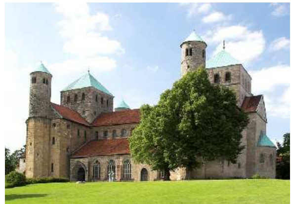
St. Michael in Hildesheim