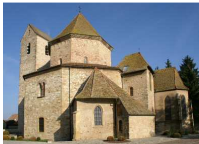
Klosterkirche Ottmarsheim

Mit Ihren Anregungen haben wir Ziel und Termine unserer diesjährigen Studienfahrt ausgewählt. Es geht ins Elsass. Die Romanische Straße (Route Romane d'Alsace) verbindet viele der 120 romanischen