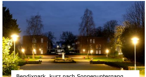
Bendixpark, kurz nach Sonnenuntergang

Der Bendix-Park mit den Blaupause-Skulpturen von David Rauer und den Bänken von Samuel Treindl ist nach Einbruch der Dunkelheit nicht wiederzuerkennen. Dank des Einsatzes der Kunstvereine wird er mit vier zusätzlichen Leuchten und zwei Punktstrahlern auf das zentrale Kunstwerk angenehm hell erleuchtet. Auch die ursprünglichen Laternen haben hellere Leuchtenköpfe bekommen. Ein Abendspaziergang lohnt sich.